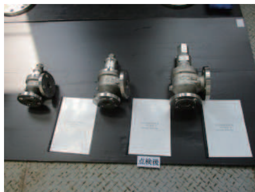
安全弁開放整備・圧力設定