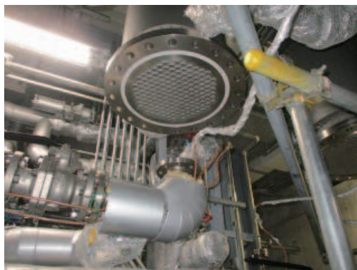
第一種圧力容器開放整備（熱交換器）