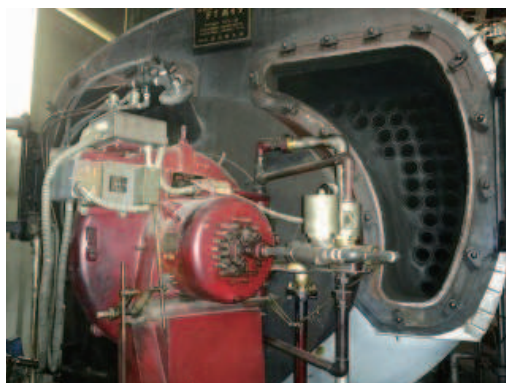
炉筒煙管ボイラー開放整備